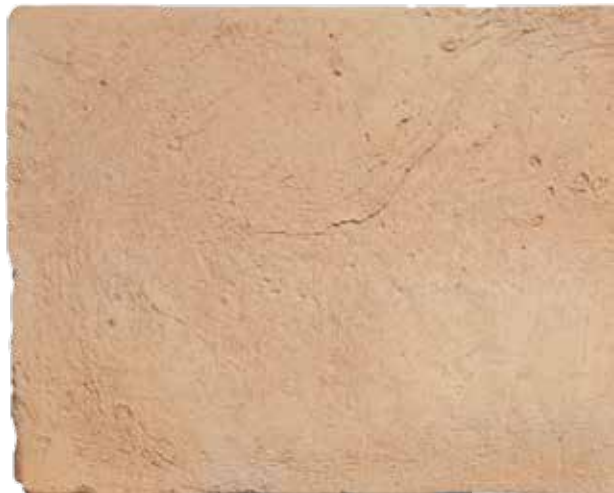
Tendente al giallo