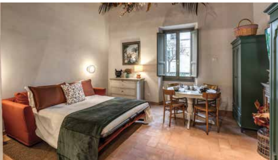
Tendente al rosa