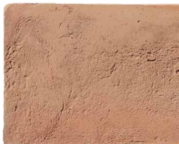
Tendente al rosa